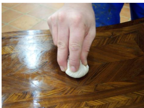
Vernis au tampon