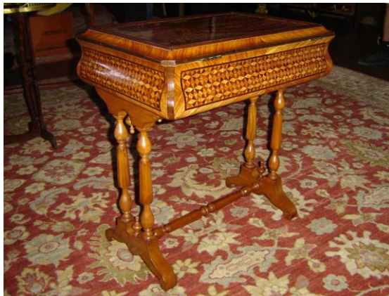
Table travailleuse louis Philippe Collection du Château d'Aulteribe

Restauration par Gaëtan MALLET BTMS Ebénisterie – Promotion N°8