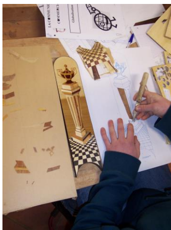
Travaux de marqueterie