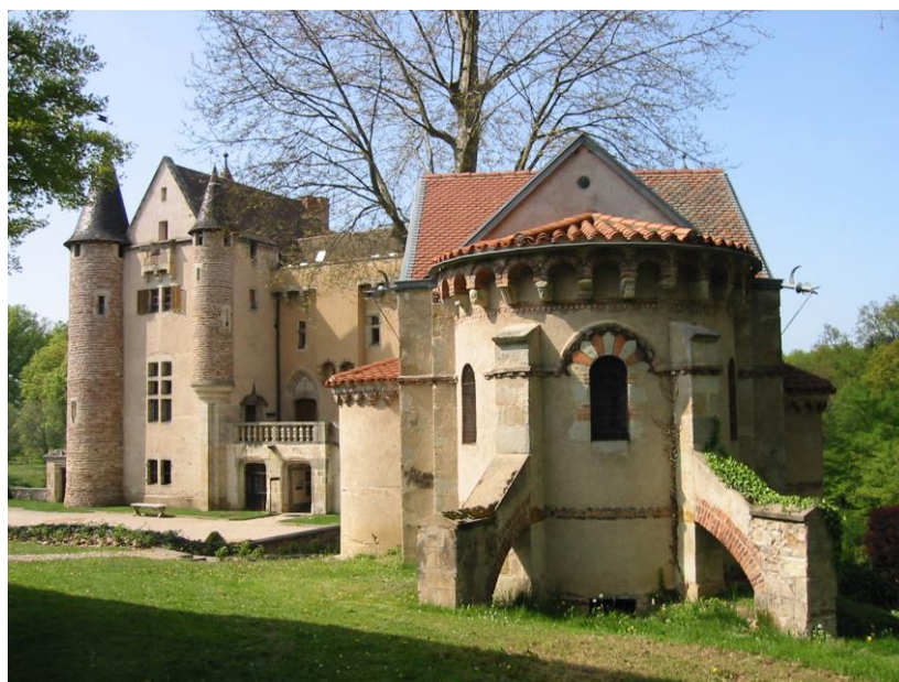
Le château de Aulteribe, à proximité de Thiers dans le Puy-de-Dôme.

Pour les enseignements professionnels, les stagiaires travaillent dans un cadre unique en matière de formation : le CHATEAU DE AULTERIBE à proximité de Thiers (Puy de Dôme).