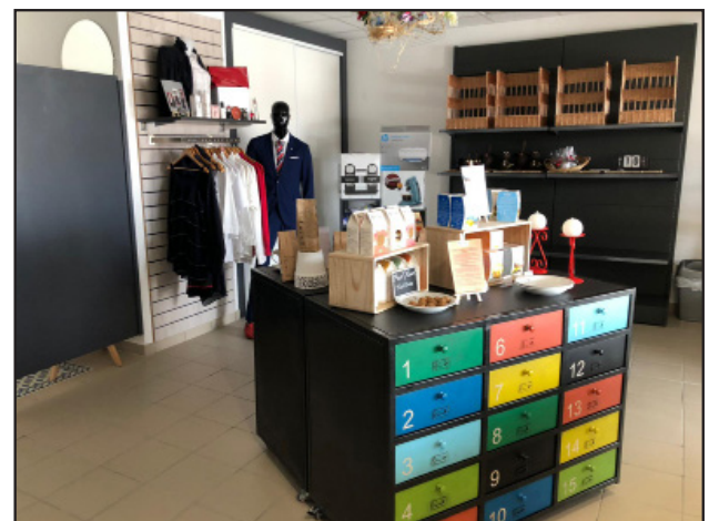
Magasin de vente - IFP 43

Formation gratuite en apprentissage et financée par les OPCO (opérateurs de compétences)