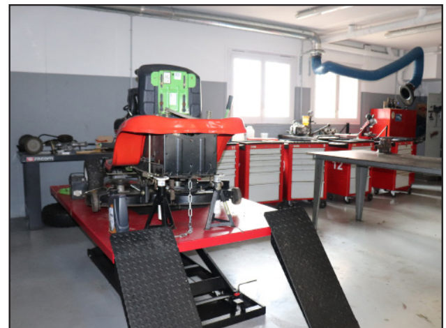
Atelier maintenance matériels - IFP 43

Formation gratuite en apprentissage et financée par les OPCO (opérateurs de compétences)